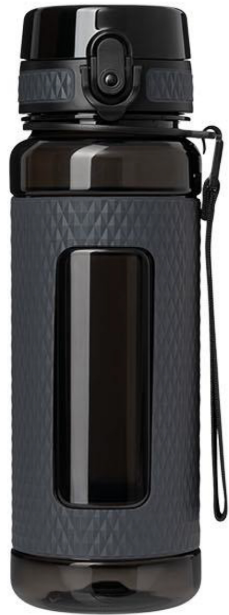
Бутылка для воды